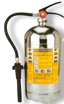
Der Pentamax® „Fünfjahres Industrielöcher“ mit Pulver oder Wasser oder Schaum und natürlich mit Prevento®