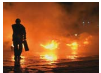
Mit dem Pentamax®-Feuerlöscher sind Sie für fast jeden Notfall gewappnet.

Prevento®Dry und Prevento®Fluid werden erfolgreich bei den Feuerwehren eingesetzt. Bei kritischen Bränden hat sich Prevento® aufgrund seiner hohen Löscheffizienz bereits vielfach bewährt.